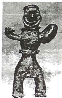
ილ-4-ბ-მეომარი მელაანის მეომარი ფიგურები (გ. ჯავახიშვილი, ტაბ. IX, სურ. 24; ტაბ. 10, სურ. 25)