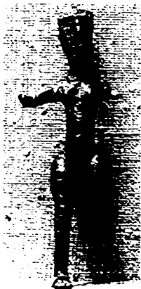
ილ-2-ქალი-ქუთაისი ქალღვთაება. ნიკო ბერძენიშვილის სახელობის ქუთაისის სახელმწიფო ისტორიული მუზეუმი.