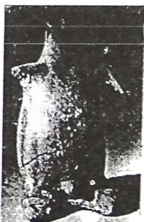
ილ-7-კაცი-კაბაში კაბით შემოსილი მამრი ღვთაება (გ. ჯავახიშვილი, 1984, ტაბ. VI, სურ. 19)