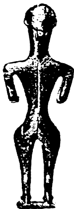
ილ-1ბ ფერსათის ღვთაება. ნიკო ბერძენიშვილის სახელობის ქუთაისის სახელმწიფო ისტორიული მუზეუმი.