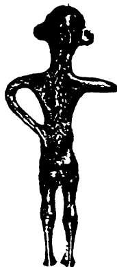
ილ-5ა-გორი ქალის ფიგურები მამაკაცის ტანშესხმით (გ. ჯავახიშვილი, 1984, ტაბ. XI, სურ. 27, 28)