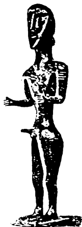
ილ-1ა ფერსათის ღვთაება. ნიკო ბერძენიშვილის სახელობის ქუთაისის სახელმწიფო ისტორიული მუზეუმი.