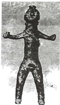
ილ-4ა-მელაანი მელაანის მეომარი ფიგურები (გ. ჯავახიშვილი, ტაბ. IX, სურ. 24; ტაბ. 10, სურ. 25)