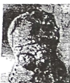
ილ-6-თავეები მძივით ქალღვთაებები ყელის სამკაულით (გ. ჯავახიშვილი, 1984, ტაბ. VI, სურ. 18)